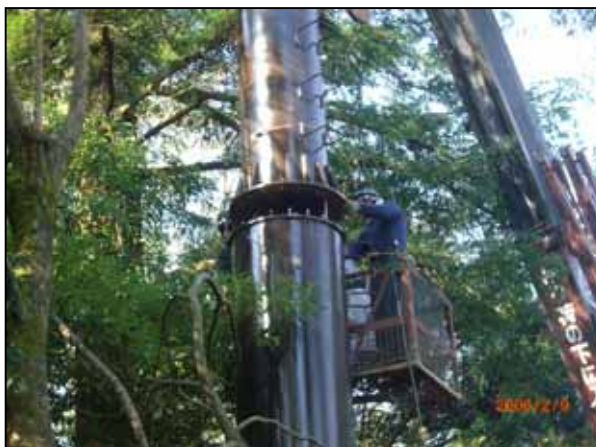
ボルト接合による施工