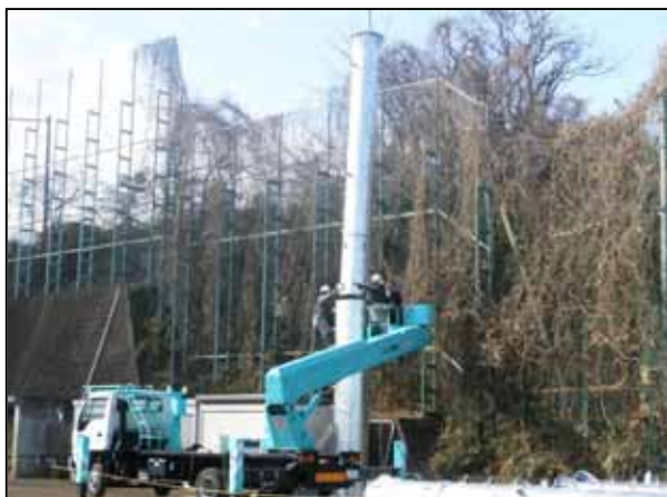
狭小な現場でのナイスジョイントによる施工