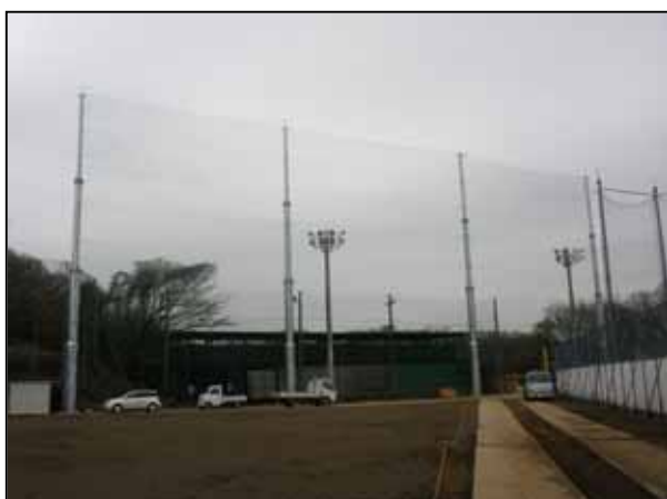
ダッグアウト前防球ネットの増設