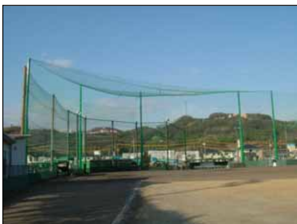
ファールボール除け天井ネットの増設