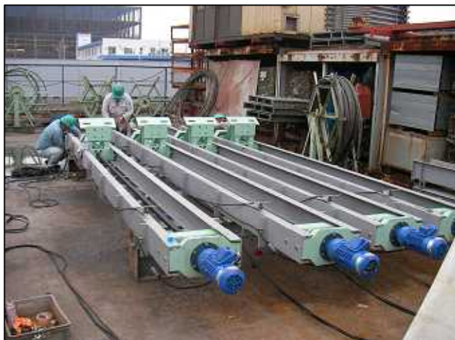
ビル工事用新型ジャッキの開発