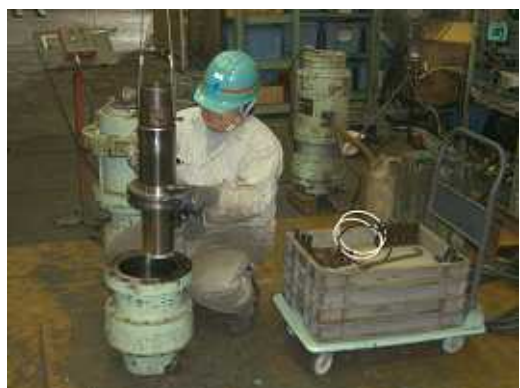
ジャッキのオーバーホール整備