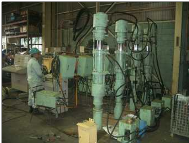
複数ジャッキの高精度連動 制御システム作動テスト

松戸工場の設備やヤードを使って、新しいジャッキシステムの技術開発・実証試験を行い、お客様のニーズにお答えしています。