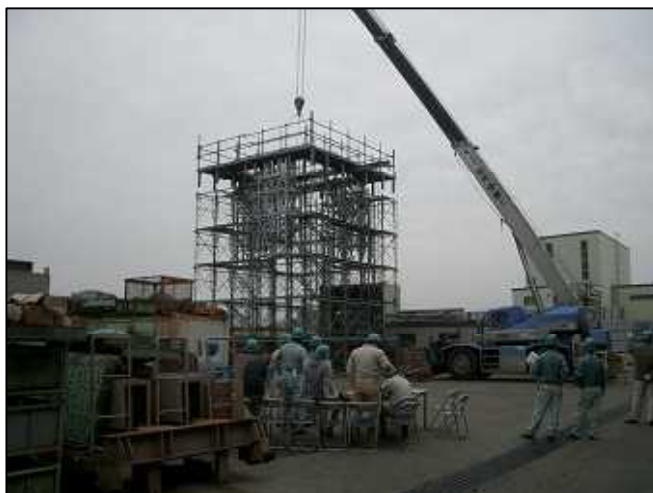
煙突工事用自動昇降架台の 実証実験