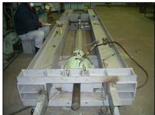
スリップフォーム工法用ジャッキ 支持ロッド強度実験