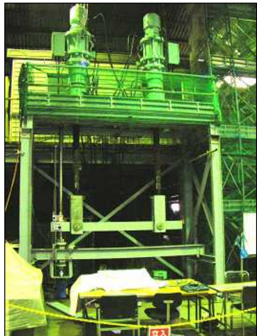
解体工法用ジャッキシステム 安全装置実験