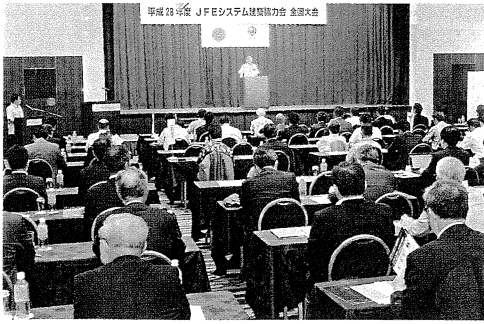
沖繩の地に会員ら約160名が参集

大規模地震にふれて「亡くなられた方々に哀悼の意を表し、被災された方々には心よりお見舞い申しあげると述べた上で、「メタルビルについては大きな被害が出ず、施工協力店一同も誇らしく思っている。今後ますますシステム建築の普及拡大を図るため、JF